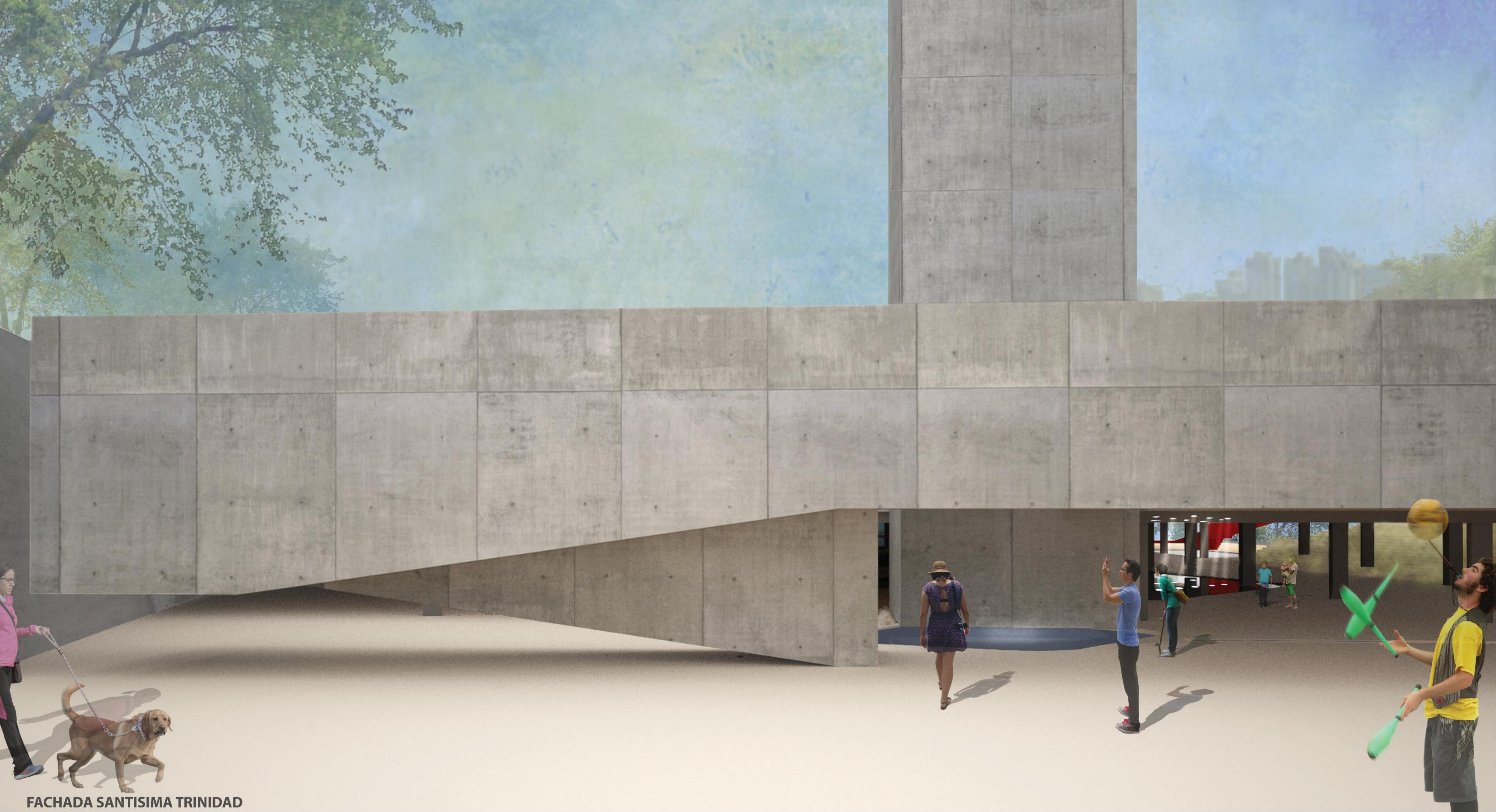
FACHADA SANTISIMA TRINIDAD