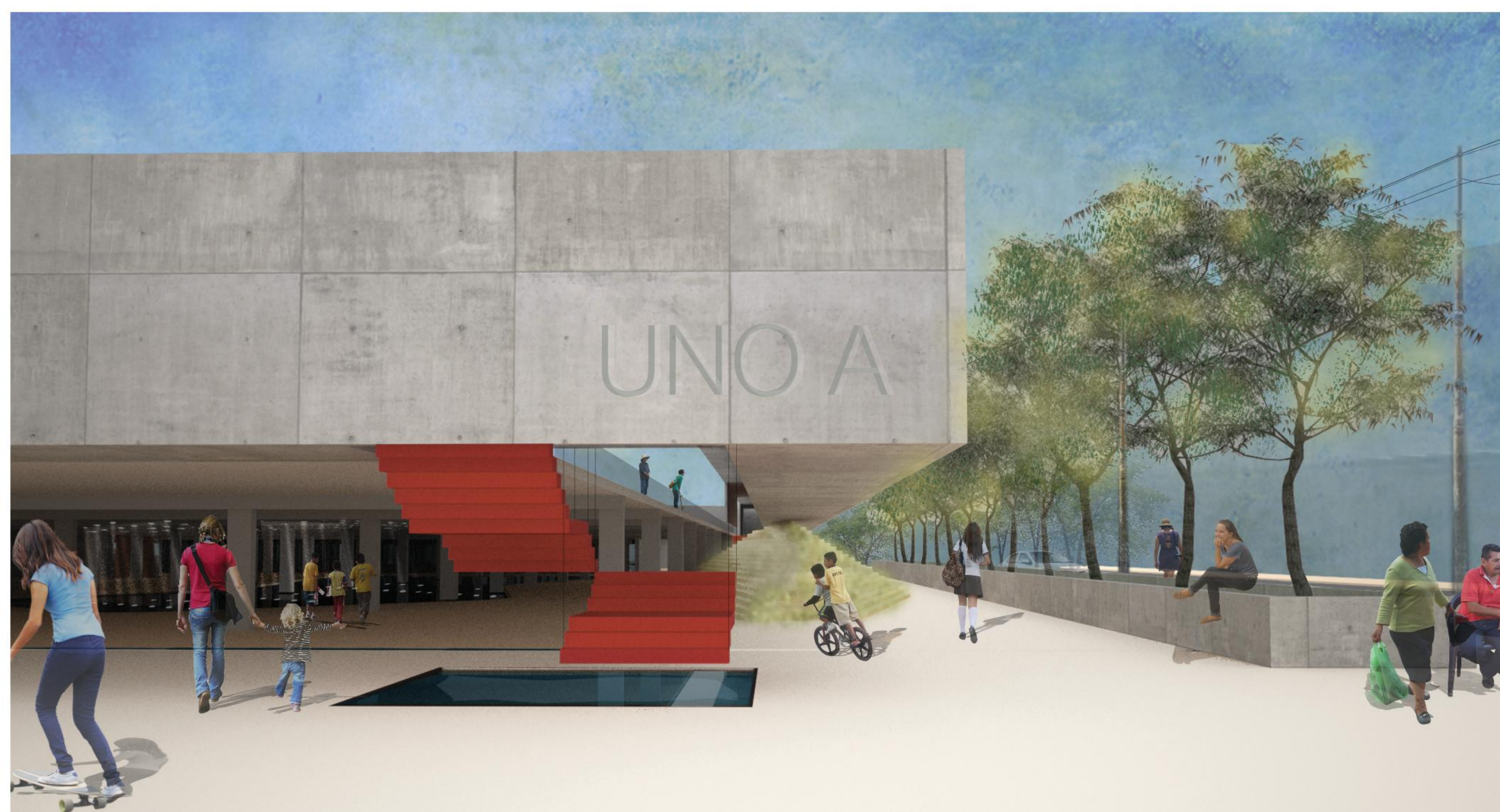
SIMBOLO DE LA ESCALERA