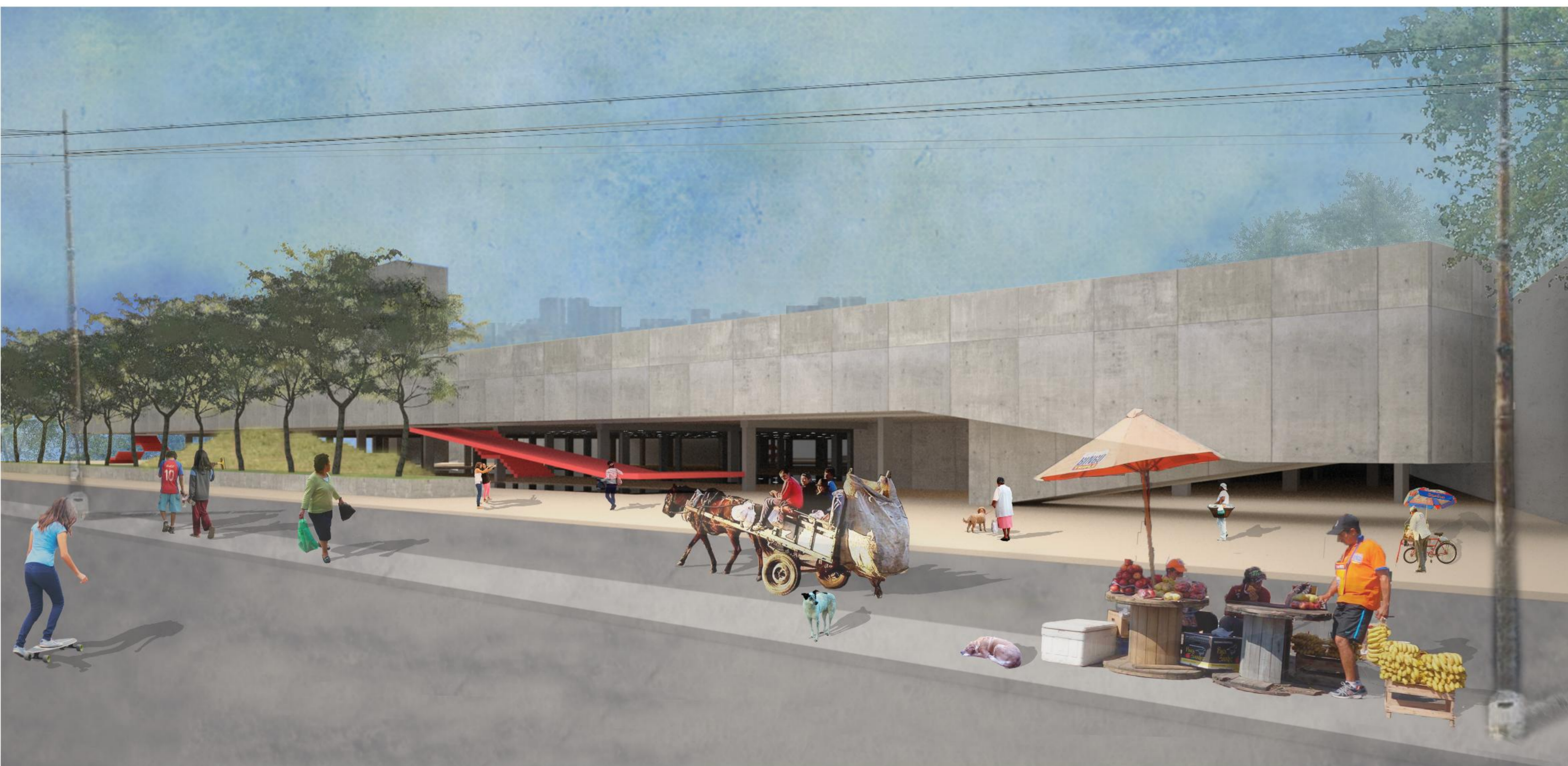
VISTA DESDE ARTIGAS