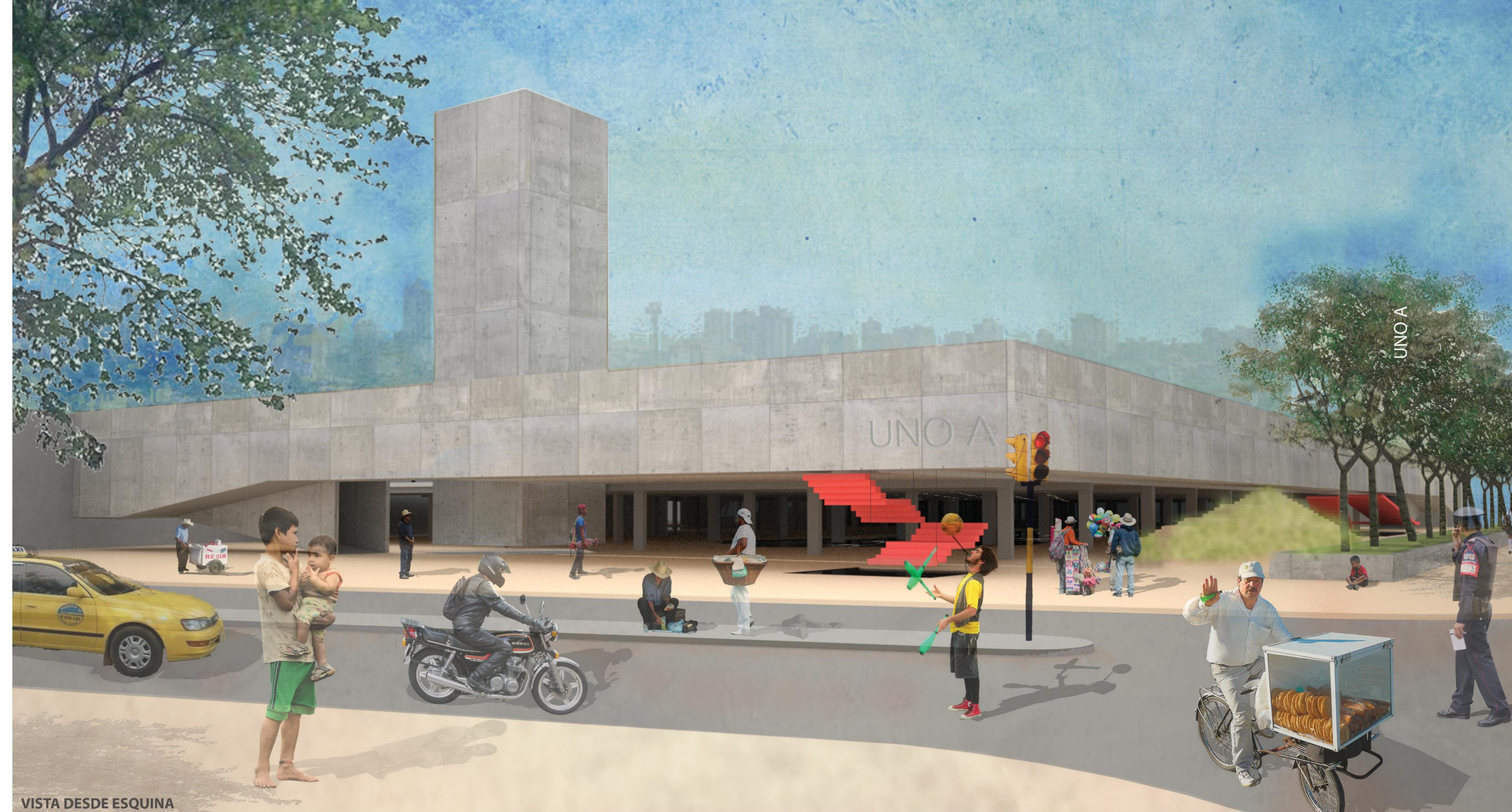
VISTA DESDE ESQUINA