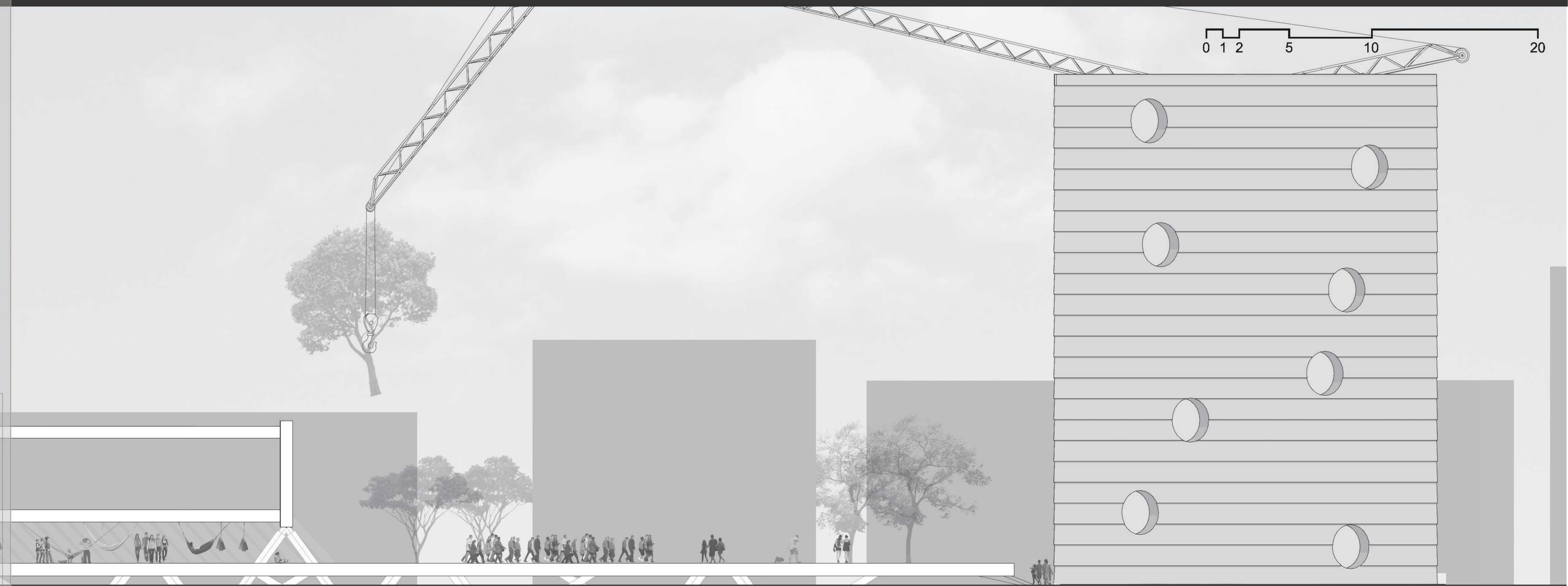
Fachada Oeste escala 1/100