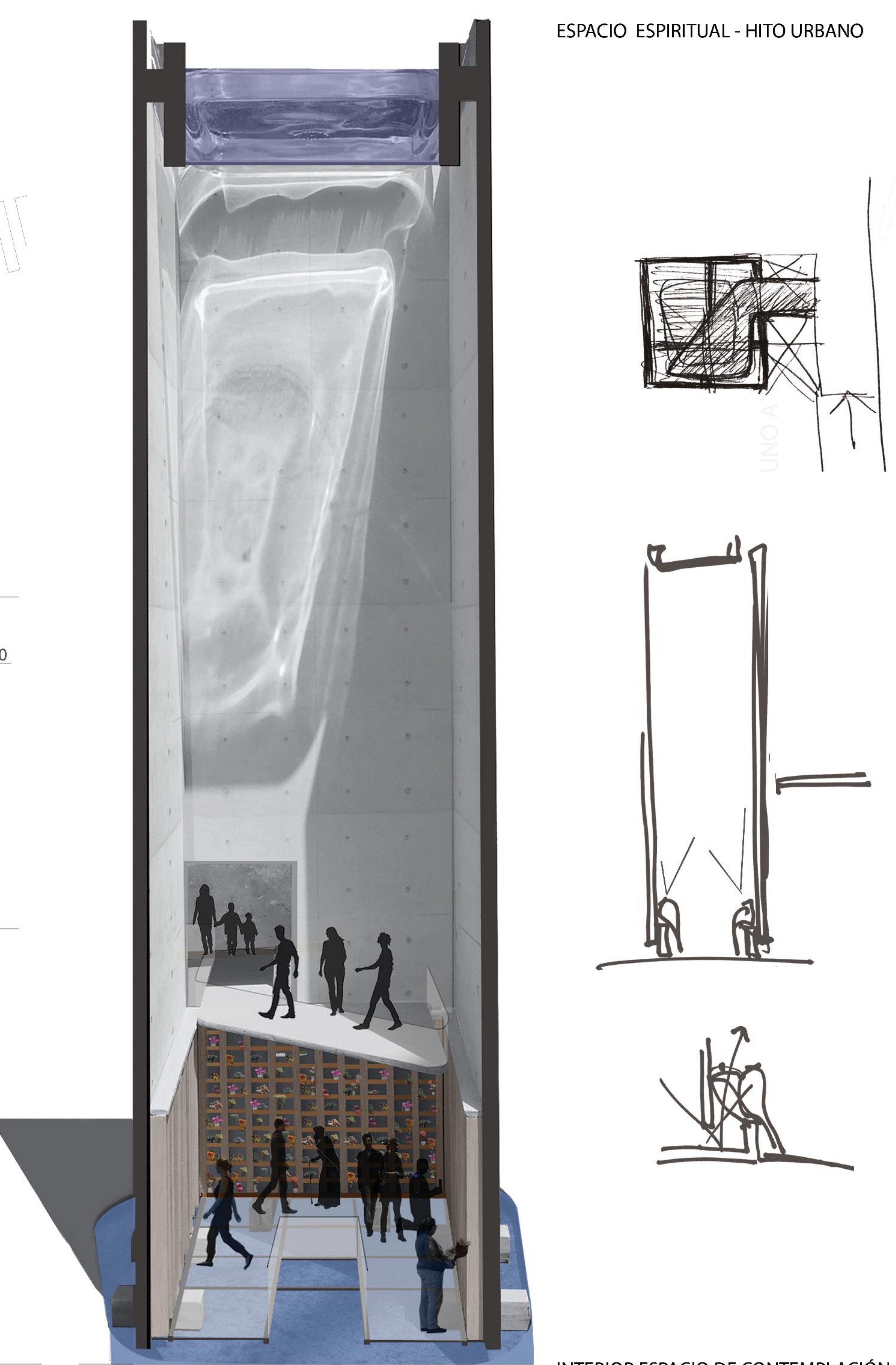
INTERIOR ESPACIO DE CONTEMPLACION