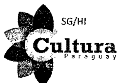
Fernando Griffith Ministro – Secretario Ejecutivo

TETÁ ARANDUPY SĀMBYHYHA SECRETARÍA NACIONAL DE CULTURA