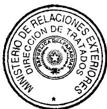
Alberto Manguel Director

ES COPIA FIDEL DEL ORIGINAL QUE OBRA EN LA DIRECCION DE TRATADOS DEL MINISTERIO DE RELACIONES EXTERIORES