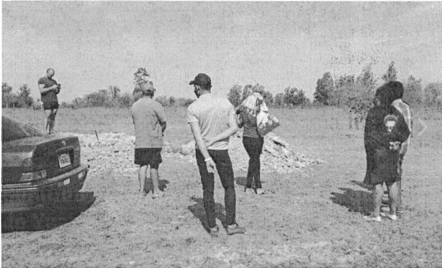
Vecinos observan una de las fosas hechas en el sitio histórico donde la Comuna habilitó un cementerio.